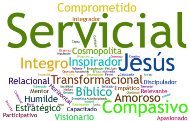
figura 3: Palabras mas recurrentes en la respuestas a la pregunta 3 generadas en Wordclouds.com

¿Qué modelo de liderazgo deseamos construir o visibilizar para una proclamación relevante del Reino de Dios en estos nuevos tiempos? Hicimos esta pregunta al liderazgo y no fue fácil agrupar las respuestas, ya que siempre fueron preguntas abiertas. Para capitalizar la riqueza de las opiniones, siempre teníamos en mente el deseo de servir a los siervos. Esto nos ayudó a señalar 5 características del liderazgo que necesitamos tener para este nuevo tiempo.