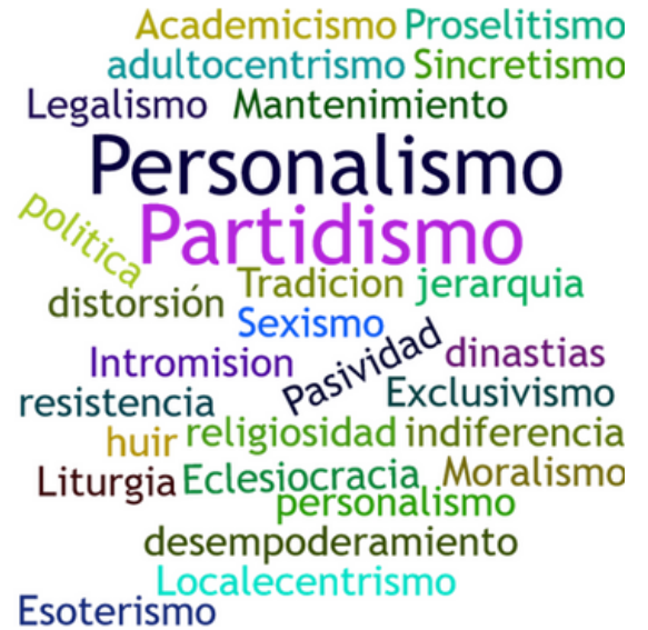
figura 2: Palabras mas recurrentes en la respuestas a la pregunta 2 generadas en Wordclouds.com

Ya sea por los sesgos cognitivos en el liderazgo, por darle más peso a la cultura que heredamos o por comodidad, indiferencia e ignorancia, corremos el riesgo de estacionarnos en lugares que pueden dificultar que la Palabra de Dios y el Espíritu fluya de la mejor manera en los nuevos contextos. Todo esto, ya sea por acción u omisión, nos puede llevar a mantener paradigmas, creencias, formas de leer o proyectar nuestros ministerios que no ayudan a experimentar el poder transformador de la gran comisión y hacer de la relevancia solo un cambio de moda. Cuando preguntamos a los líderes sobre qué imaginarios deberíamos desmontar en nuestras iglesias, las respuestas se agruparon en tres grandes temas :