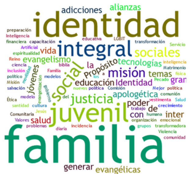
figura 1: Palabras mas recurrentes en la respuestas a la pregunta 1, generadas en Wordclouds.com

“Necesitamos enfocarnos en la familia como fundamento para la restauración de una sociedad en crisis”.